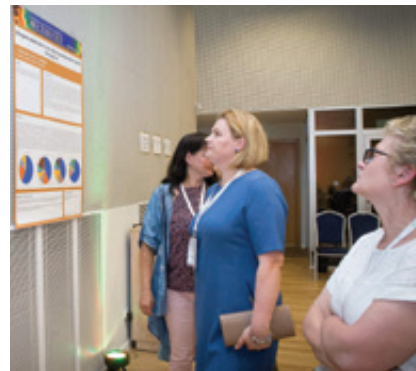
Stendinių pranešimų sesija