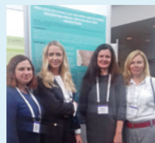
Stendinių pranešimų pristatymas