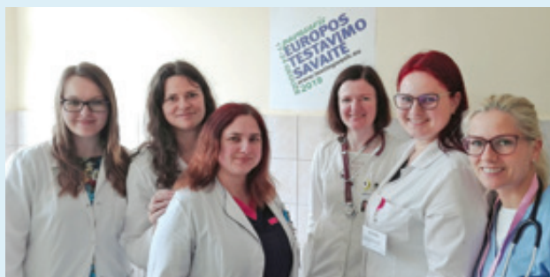
Europos testavimo savaitės savanoriai

2019 metais gegužės 17–24 dienomis Lietuvos infektologų draugija dalyvavo Europos testavimo savaitėje. Kau-no klinikinėje ligoninėje iš viso buvo ištirta 140 asmenų greitaisiais ŽIV ir hepatito C testais, nustatyti 4 teigiami hepatito C tyrimai, ŽIV teigiamų nenustatyta. Planuojama dalyvauti ir kitose panašiose testavimo savaitėse.