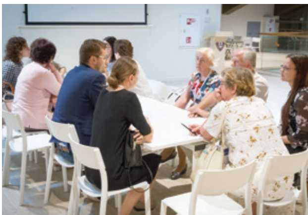
LID darbo grupių susitikimai