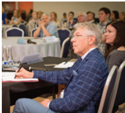
Konferencijos Infektologija 2019 akimirkos