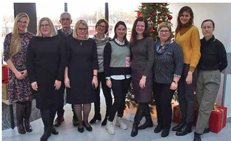
Kauno krašto infektologai lankosi Vilniaus universiteto ligoninės Santaros klinikų Infekcinių ligų centre