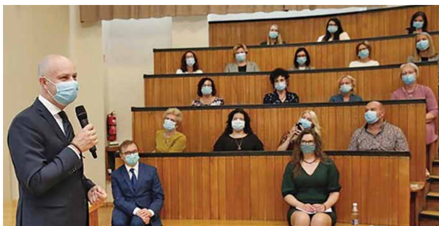
Sveikatos apsaugos ministras apdovanoja Kauno regiono medikus