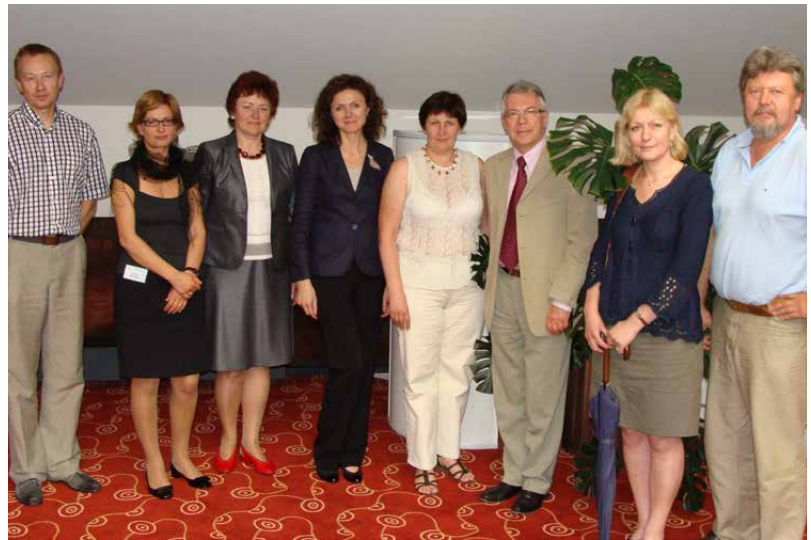
LID valdybos nariai 2011 metais. Palanga, viešbučio Vanagupė konferencijų centras

Apdovanotas Vilniaus medicinos draugijos diplomu už geriausią mokslo darbą, praktiškai panaudojant virusinio C hepatito diagnostikos metodą (1992 metai). Laimėjo Jungtinių Amerikos