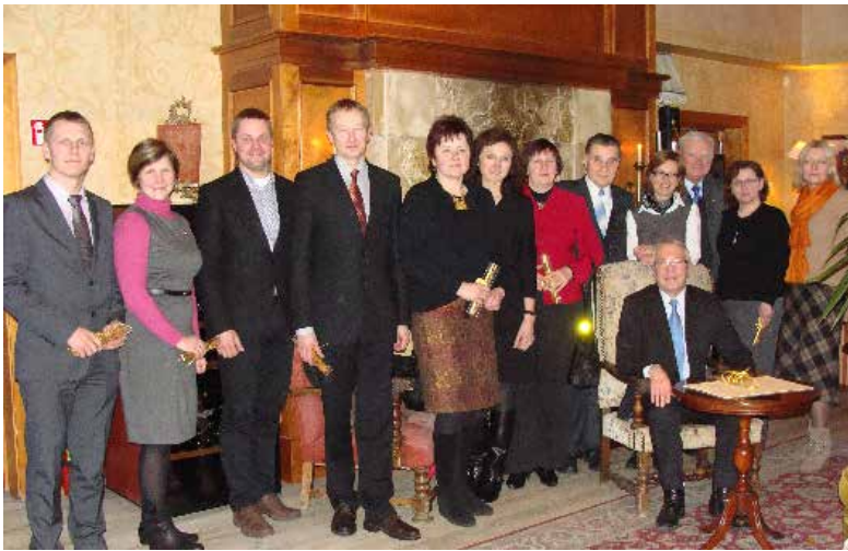
2011–2012 metų LID suvažiavimas Trakuose