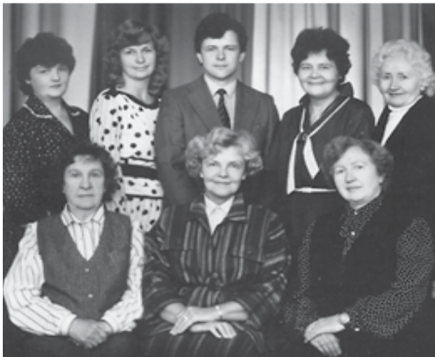
Kauno miesto infektologų mokslinės draugijos valdyba (1988 metai)

Apdovanotas Gedimino ordino Karininko kryžiumi (2004 metais), Prancūzijos Akademinį palmių ordinu (2005 metais).