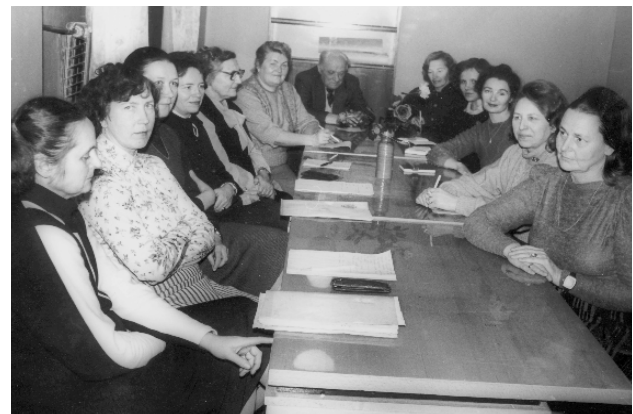
Akimirkos iš LID kraštų draugijų veiklos