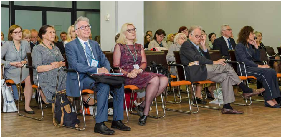
LID konferencija Infektologija 2017

2020–2021 metais – nuotolinės konferencijos.