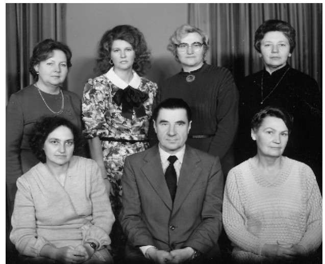
LID Vilniaus infektologų draugijos valdyba 1984–1994 metais