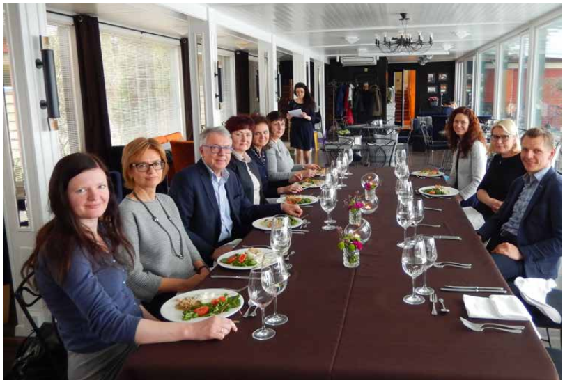
Trumpas atokvėpis po intensyvos darbo dienos (LID suvažiavimas ir LID valdybos posėdis 2017 metų balandžio 15 dieną Trakuose)