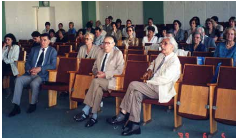
1999 metų LID suvažiavimas Klaipėdoje

2005 metų gegužės 9 dieną LID buvo priimta į Europos klinikinės mikrobiologijos ir infekcinių ligų draugiją (angl. ESCMID), tapo su ESCMID afiliuotoji šalies draugija.