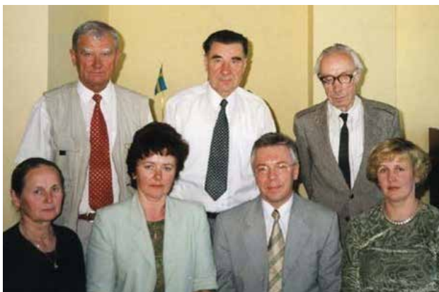
LID valdyba 2002 metais. 2002 06 07 LID konferencija Reti ir diagnostškai sudėtingi infekcinių ligų atvejai (Palanga)

1990–2002 metais dirbo Vilniaus universiteto Infekcinių ligų klinikos vedėju, 2002–2006 metais – Vilniaus