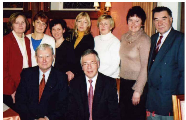
LID valdybos nariai 2003 metais. 2003 01 13 LID valdybos posėdis Trakuose