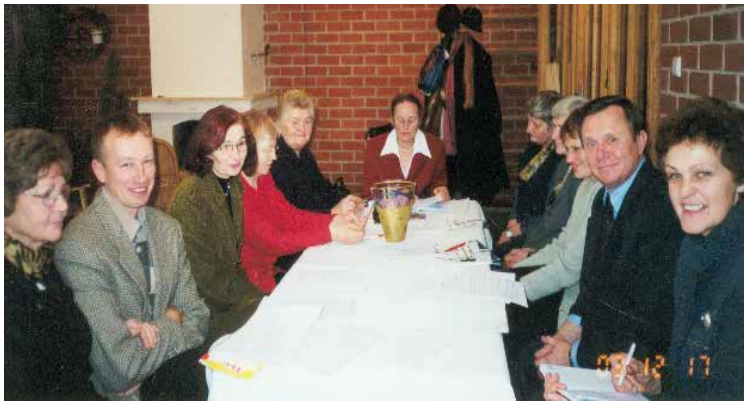
Akimirkos iš LID kraštų draugijų veiklos