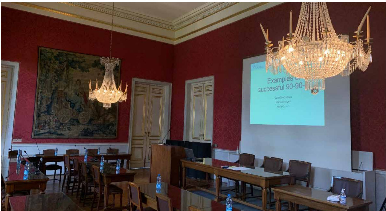
Jaunųjų mokslininkų konferencija 2022 (YING Conference 2022) Belgijos karališkojoje mokslo ir menų akademijoje